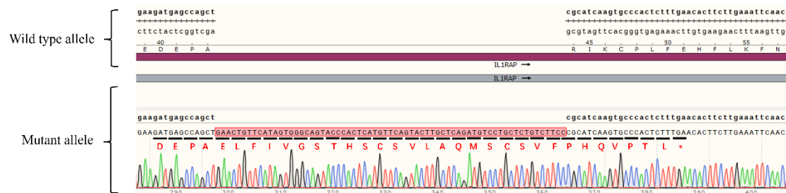
Fig. The Sanger sequencing of the H_IL1RAP KO HEK-293 Cell Line showed successful knockout of IL1RAP.