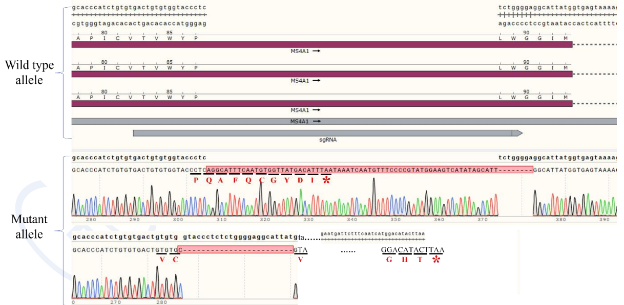
Fig 3. The Sanger sequencing of the H_CD20 KO RAMOS Cell Line showed successful knockout of CD20.